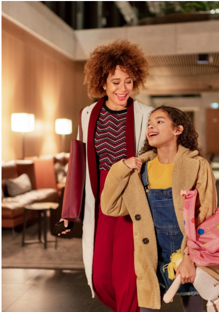
Energy and Building Technology